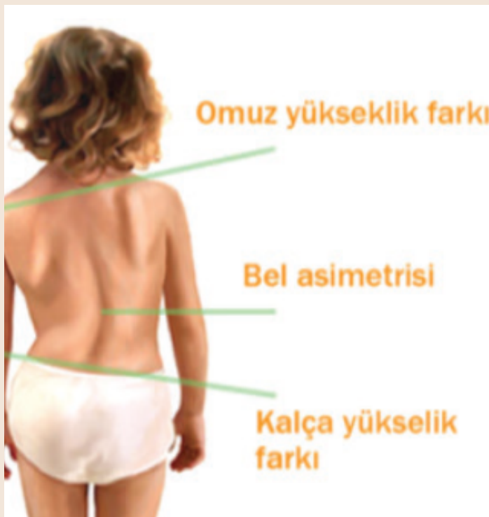
Görsel 3: Skolyozlu bireylerde sık karşılaşılan fiziksel belirtiler

Tümörler, kas hastalıkları, Serebral Palsi, Sipina Bifida, omurilik yaralanmaları, alt ekstremite kısıklıkları, duruş bozuklukları skolyozun en temel nedenlerindedir. Ayrıca; cinsiyet, büyüme hızı, genetik faktörler, obezite gibi birçok faktör skolyoz oluşumundan sorumlu tutulmaktadır. Genellikle de sağlıklı bireylerde büyüme döneminde ortaya çıktığı düşünülmektedir. Eğrilik açısı arttıkça bel ve sırt ağrıları artar. Eğriliğin artma hızı yaş, cinsiyet, büyüme gibi faktörlerden etkilenir. Özellikle de ergenlikteki bireylerde ani boy uzamasına bağlı olarak eğrilikte artmalar meydana gelebilir. Bu yüzden 12-18 yaş arasındaki bireyler risk altındadır. Skolyozu olan bireylerde genellikle bir omuz diğerinden daha yüksek, kürek kemiklerinde biri diğerinden daha belirgin olabilir. Kalçalar eşit seviyede olmayabilir ve gövde bir tarafa doğru yer değiştirmiş olabilir. Bir ekstremitenin diğerinden daha uzun görünebilir.