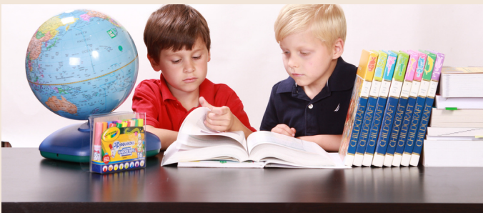
I.Pamukkale Üniversitesi Eğitim Fakültesi Dergisi 1999, Sayı 5.

Sonuç olarak; öğrencilere ev ödevi verilmemesi biçimindeki bir yaklaşımdan çok verilecek ev ödevlerinin miktarının, niteliğinin, kalitesinin ve zamanının öğrencinin yaş ve sınıf düzeyine uygun olması, özellikle ilkokul çağındaki çocuklarda çalışma alışkanlığı kazandırma amaçlı ve ölçülü olması çok daha gerçekçi sonuçlara, verimliliğe ve gelişime uygun olacaktır.