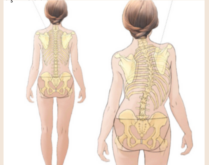
Görsel 1: Normal omurga orta hatta hizalanırken, skolyozlu omurganın yana doğru eğriliği

Skolyoz terimi ise antik Yunancadaki eğri, eğrilik anlamına gelen "skolios" kelimesinden türemiş olup MS. 130-201 yıllarında Galen tarafından tanımlanmıştır. Çocuklarda ve 12-18 yaş arasındaki bireylerde sık sık karşılaşılan skolyoz, normalde arkadan bakıldığında orta hatta hizalanması gereken omurgamızın 10 derece üzerindeki yana eğriliğidir. Bazen bu eğriliğe kemik yapıların rotasyonu da eşlik edebilir.